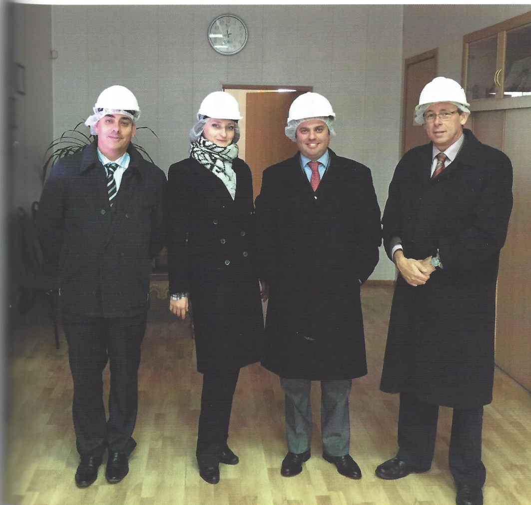
Миссия в России в 2015 году: строительство трубного завода и создание российского представительства компании. "Missão Rússia 2015" - para construção de fábrica de tubos e representação de empresa russa.

Sabemos quem somos e quais os valores que nos regem. O girassol que nos representa significa felicidade. As suas cores simbolizam calor, lealdade e vitalidade. Esta é uma flor que procura a luz para crescer, que se adapta na busca pelo seu sucesso e que se destaca pelas suas características.